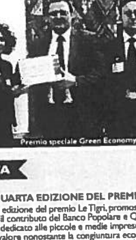
Premio speciale Green Economy a Kingfisher Polymers

siche e comunicative. Il sistema ideato darà ai pazienti l'opportunità di comunicare a livelli inimmaginabili fino a pochi anni fa. L'innovazione a sfondo sociale corre anche nel comparto della sostenibilità ambientale: c'è chi, come Kingfisher Polymers, ha ideato soluzioni ad hoc per risolvere il problema dello smaltimento dei rifiuti, riducendo l'impiego di risorse naturali vergini. I potenziali clienti? Tutte le industrie che si servono di materiali plastici a basso prezzo. Complessivamente l'iniziativa, promossa da grandi del servizio