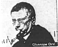
DI STEFANO VECCHIA

Nel pomeriggio di ieri il Rajya Sabha, il Senato indiano, ha approvato la nascita di un Comitato parlamentare congiunto per indagare a livello politico sulla responsabilità nel "caso" degli elicotteri AgustaWestland e i presunti di corruzione legati al lotto di costruzione legata al lotto di acquisto di parte dell'aviazione militare indiana.