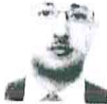
Tessera N. NN000275 Emessa il 28/03/2018