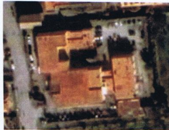
Scuola Elementare E.Fermi