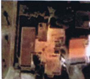
SM Ada Negri